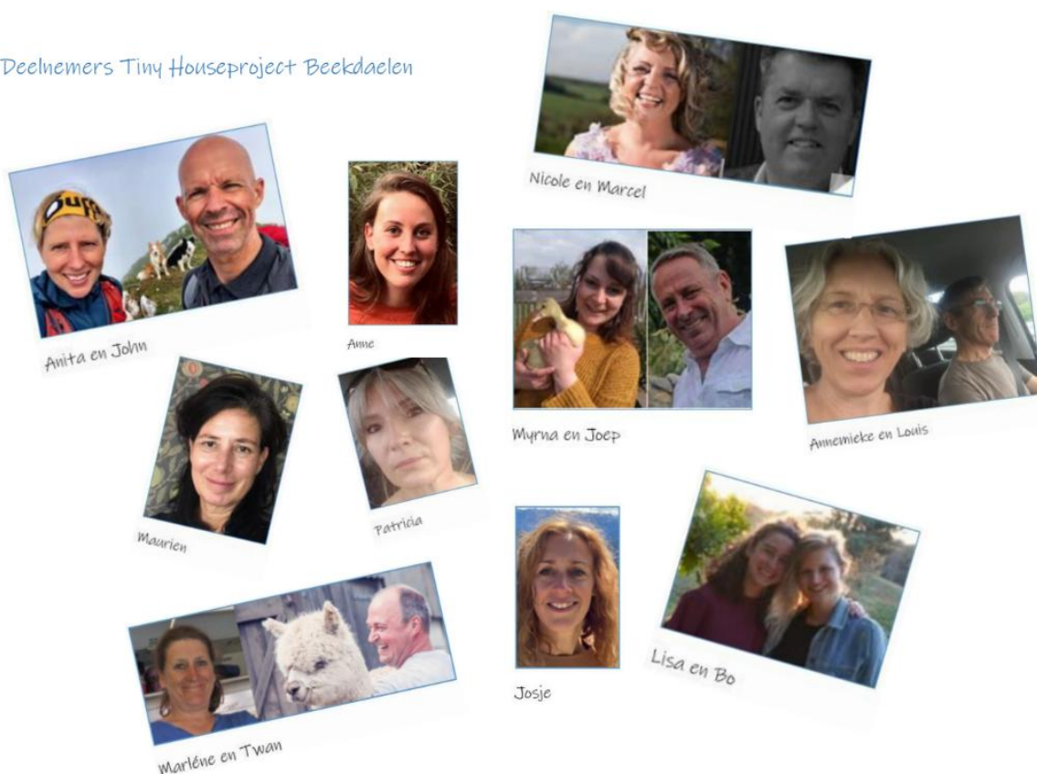
Figuur 1 De initiatiefnemers van het eerste uur