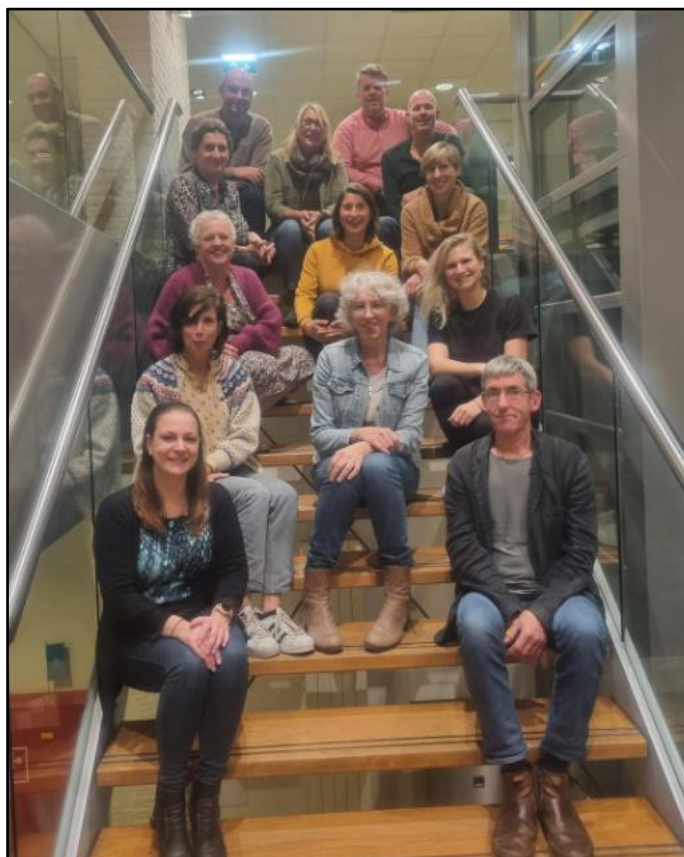
Foto deelnemers van 22 oktober 2021