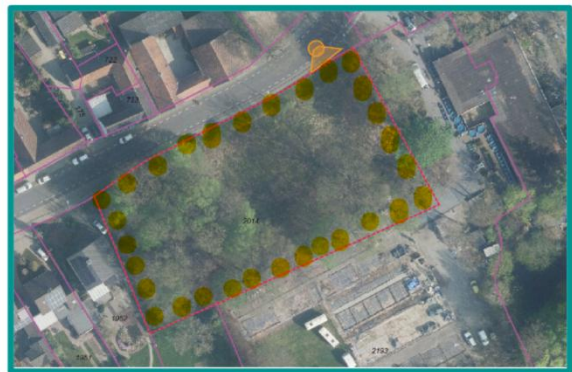
Figuur 2 Ligging terrein aan de locatie Op de Bies 66